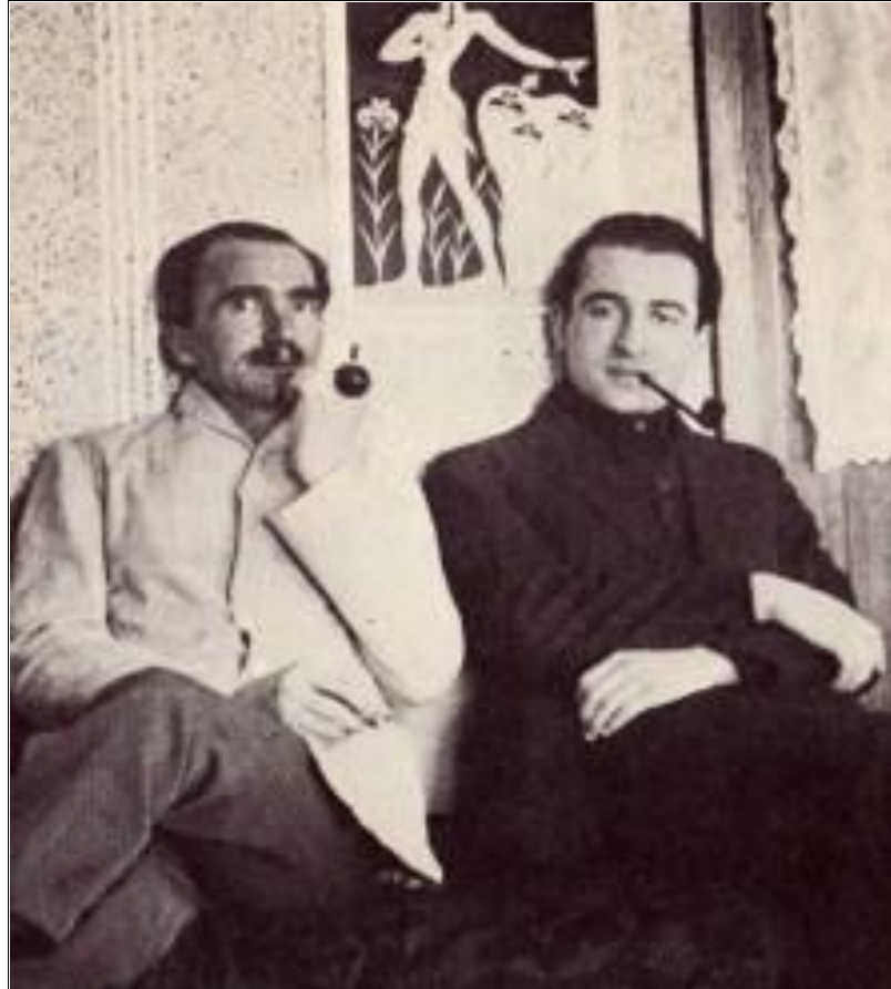
Νίκος Καζαντζάκης, Παντελής Πρεβελάκης στο Gottesgab της Τσεχίας (1932)