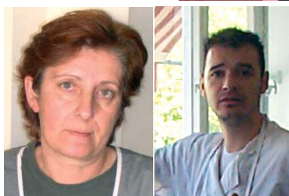
Φίλοι και συνεργάτες της ΟΑΚ.