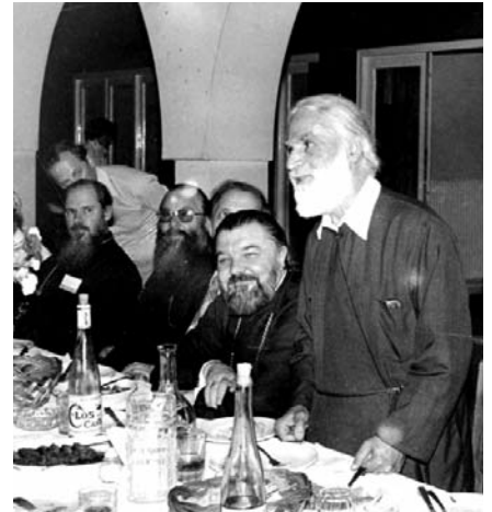
Πρῶτος ἀπὸ ἀριστερὰ ὁ τότε Ταλλίν και Εσθονίας Αλέξιος στὴν ΟΑΚ (1979)

Μόσχας στὴν 8η Γεν. Συνέλευση τοῦ ΚΕΚ (18-26 Οκτωβρίου 1979). Κατὰ τὴ διάρκεια ΓΕΥΜΑΤΟΣ ΑΓΑΠΗΣ, πὸν παρέθεσε ὁ Ἀρχηγὸς τῆς Ἀντιπροσωπείας τοῦ Οἰκ. Πατριαρχείου Μητροπολίτης Μύρων (μετέπειτα Ἐφέσου) κυρός Χρυσόστομος πρὸς τιμὴν τῶν Ορθοδόξων ἐκπροσώπων στὴ Συνέλευση (23.