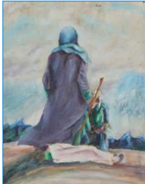
Από την Πινακοθήκη της ΟΑΚ

Η συμβολική της ευαγγελικής περικοπής των Χριστουγέννων (βλ. Μτ., 2:1-12) είναι η άλλη όψη της σημερινής κατάστασης του προσφυγικού προβλήματος στην Ευρώπη. Όμως, λησμονούμε ότι στο πρόσωπο του κάθε πρόσφυγα που καταδιώκεται κι αναζητά καταφύγιο είναι ο ίδιος ο Χριστός καθώς, «αἱ ἀλώπεκες φωλεοὺς ἔχουσιν καὶ τὰ πετεινά τοῦ οὐρανοῦ κατασκηνώσεις, ὁ δέ υἱὸς τοῦ ἀνθρώπου οὐκ ἔχει ποῦ τὴν κεφαλὴν κλίνει» (Μτ., 8:20). Γιατί, μονάχα εκείνος που έχει διωχθεί σαν τον Χριστό ξέρει καλά, «πώς είναι να φτάνεις νύχτα στην ακτή μιας άγνωστης Χώρας, να πηδάς στο νερό από μία βάρκα με την οποία διέσχισες τη θάλασσα μέσα στο σκοτάδι, θέλοντας να απομακρυνθείς γρήγορα προς το εσωτερικό, καθώς τα πόδια σου βυθίζονται στην άμμο. Ένας άντρας μόνος, χωρίς χαρτιά, χωρίς χρήματα, που έχει φτάσει από τη φρίκη των ασθενειών και των σφαγών της Αφρικής, από την καρδιά του σκότους, που δεν ξέρει τίποτα για τη γλώσσα της Χώρας όπου έφτασε, που πέφτει στο έδαφος και κουλουριάζεται σ' ένα χαντάκι στην άκρη του δρόμου όταν βλέπει να πλησιάζουν από τον αυτοκινητόδρομο τα φώτα ενός αυτοκινήτου, ίσως της αστυνομίας» 1 .