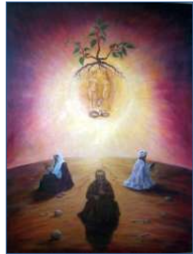
PEKIE Ernst-Hermann. Από το Πρόγραμμα της ΟΑΚ «Πρόσωπο προς Πρόσωπο»

Ένας χρόνος πέρασε από τη σύγκληση της Αγίας και Μεγάλης Συνόδου της Ορθοδόξου Εκκλησίας (Ιούνιος 2016), η οποία πραγματοποιήθηκε σε μία κρίσιμη χρονική στιγμή, οικονομικών, πολιτικών, κοινωνικών και θρησκευτικών προβλημάτων, που αφορούν ολόκληρη την ανθρωπότητα. Τόσο στο Μήνυμα, όσο και στην Εγκύκλιο της παραπάνω Συνόδου, τονίζεται η σημασία των θεολογικών διαλόγων μεταξύ των θρησκειών για την αντιμετώπιση της βίας και την υπεράσπιση της Ειρήνης. Δυστυχώς, όμως, οι εκρήξεις φονταμενταλισμού που παρατηρούνται στους κόλπους των διαφόρων θρησκειών αποτελούν έκφραση νοσηρής θρησκευτικότητας. Η Α.Θ.Π. ο Οικουμενικός Πατριάρχης κ.κ. Βαρθολομαίος Α' στην πρόσφατη ομιλία του στη Διεθνή Διάσκεψη για την Ειρήνη, στο Πανεπιστήμιο Al-Azhar (Κάιρο/Αίγυπτος), τόνισε, μεταξύ άλλων, την αξία της θρησκείας ως κεντρική διάσταση της ανθρώπινης ζωής σε προσωπικό και κοινωνικό επίπεδο και συγχρόνως τη συνεισφορά της στα σύγχρονα δημόσια θέματα που αφορούν την κοινωνία, αλλά και για τη σημασία του διαλόγου για την επίλυσή τους. Παραθέτουμε μερικά αποσπάσματα αυτής της σημαντικής ομιλίας του Παναγιωτάτου, με θέμα «Θρησκεία και Ειρήνη», στη μνήμη των εκατοντάδων θυμάτων από τις πρόσφατες τρομοκρατικές ενέργειες σε όλο τον κόσμο!